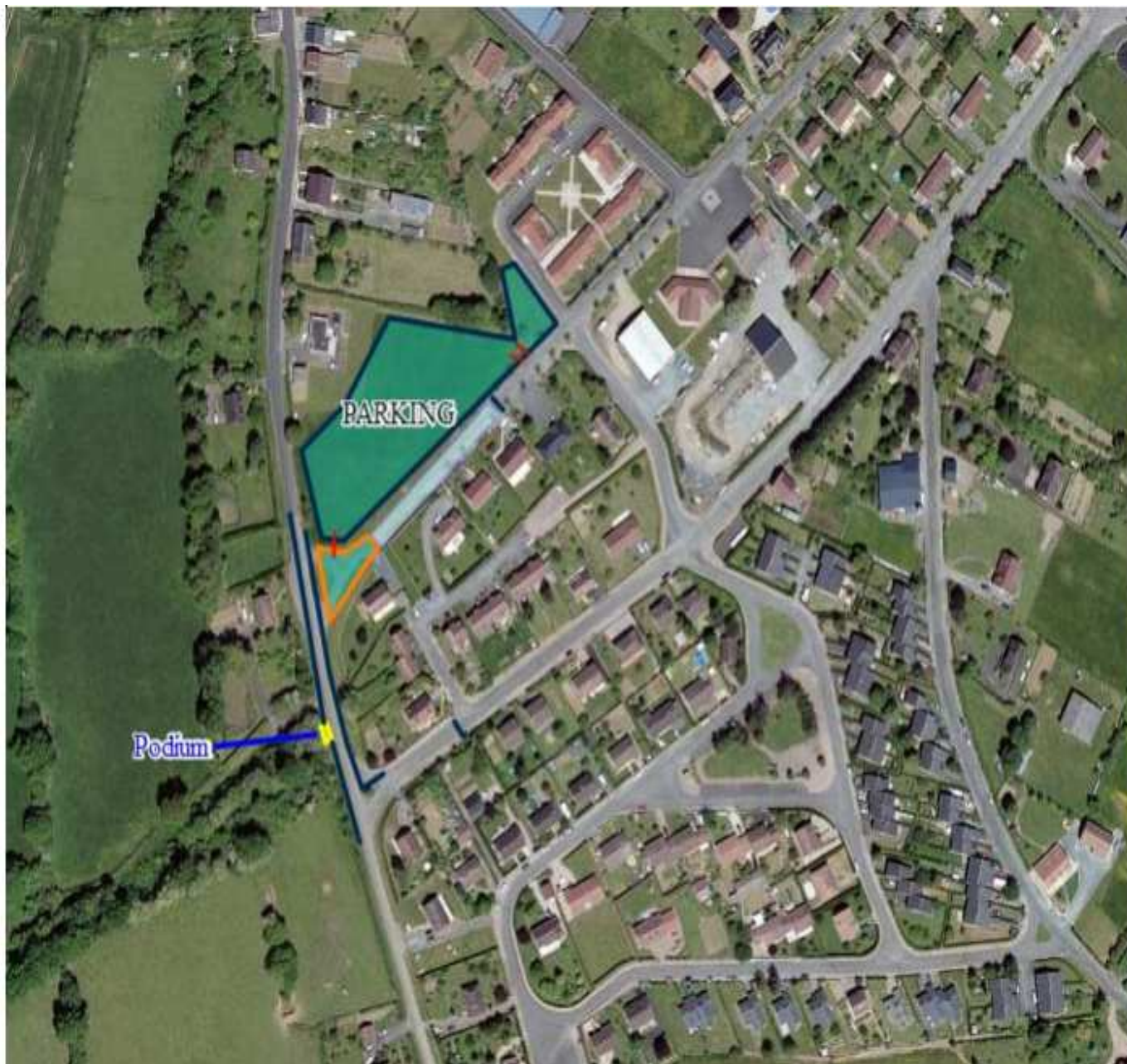
Site du Championnat Route d'Aigurande